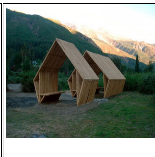
Google vergelijkbaar ontwerp