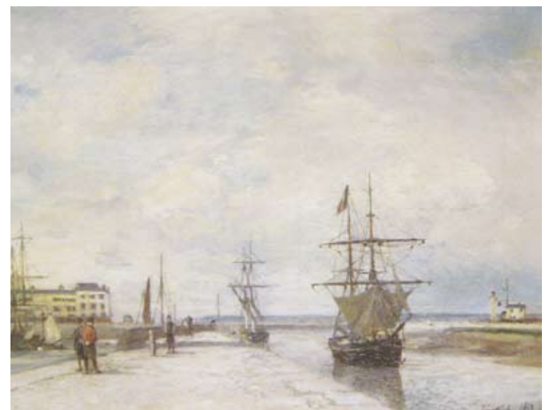
Boven: Camille Corot, La berge d'une rivière . Gustave Courbet, Les bords de la mer à Palavas . Onder: Jacob Maris, De Strandvisser (detail) . Johan Barthold Jongkind, La jetée en bois dans le port de Honfleur .

realistische schilderwijze duidelijk wordt gemaakt. Getoond wordt hoe binnen de Franse landschapschilderkunst het kleurgebruik verandert, de toets losser wordt en er meer levendigheid in de schilderijen wordt gebracht. Schilders als Theodore Gudin, Eugène Isabey en Narcisse Diaz de la Pena blijken wegbereiders voor Georges Michel en Jules Dupré, die zich meer vrijheid veroorloven in de weergave van het landschap, zoals in de tentoonstelling is te zien. Essentieel daarbij is het 'en plein air'-schilderen: kunstenaars trekken naar buiten om te werken, hun gemoed open te stellen voor de bewegingen van de natuur en zich te laten inspireren door de veranderende atmosferische omstandigheden. Charles Daubigny, Camille Corot en Gustave Courbet tonen op de expositie de ruimte die zij als